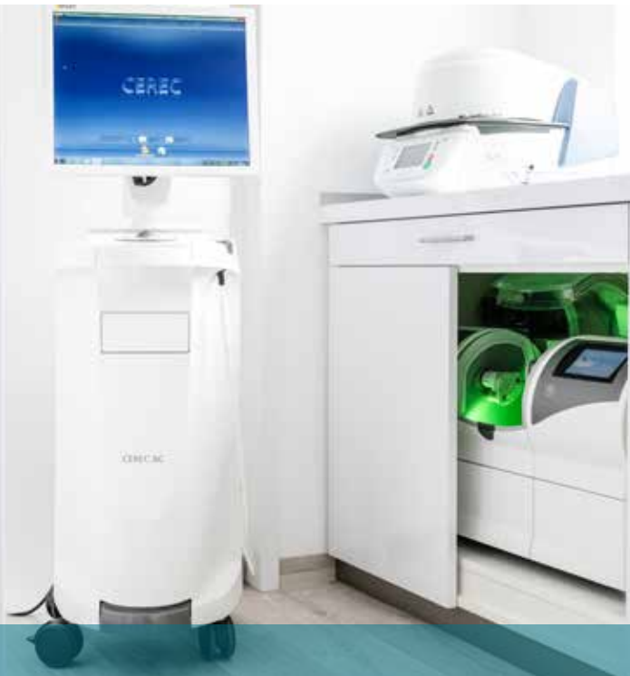
Moderne digitale Technik: Das CEREC-System ermöglicht Vollkeramikrestaurationen ohne Abdruck und ohne Provisorium in ein und derselben Sitzung.

Für persönliche Gespräche mit dem Kunden steht ein Büro- raum zur Verfügung, der die benötigte Privatsphäre bietet. „Pure heißt nicht, wenig zu machen, sondern viel in Bewegung zu setzen, damit das Ergebnis minimalistisch ist“, so Eva Heinrichs. „Was die äußere Form betrifft, gilt für mich: Form follows function.“