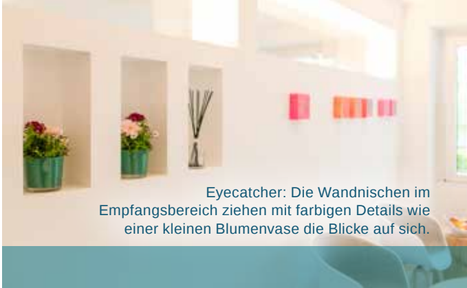
Eyecatcher: Die Wandnischen im Empfangsbereich ziehen mit farbigen Details wie einer kleinen Blumenvase die Blicke auf sich.